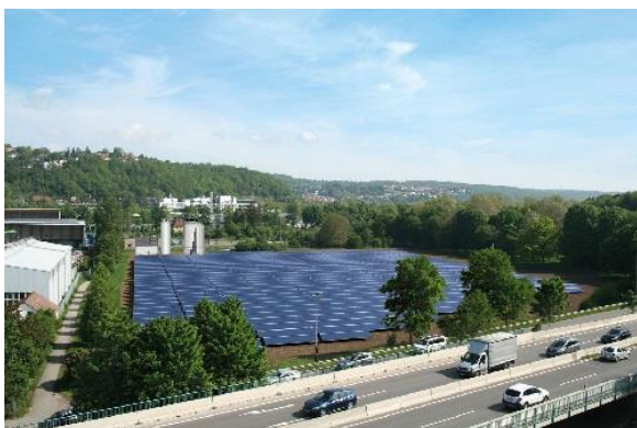
Rendering Solarthermiepark Au