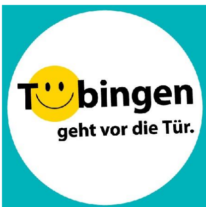
Logo: Tübingen geht vor die Tür

Auch wenn er bei Redaktionsschluss schon ausgebucht war, möchten wir doch den 20. Tübinger Abendspaziergang nicht unerwähnt lassen, der am 13. März unter dem Motto „Im Westen nichts Neues? Oh doch!“ stattfindet. Der von WIT und HGV organisierte Abend bietet einen Blick hinter die Kulissen von Café OONIKAT in der Schmiedtorstraße, Mohr Optik in der Ammergasse, FRAU ANNE Süßes & Schleck im Schleifmühlweg und Kornblumen Kunst & Kultur in der Haaggasse. www.tuebingen-abendspaziergang.de