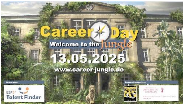
Bild: Career Day