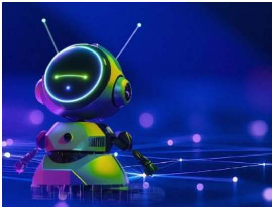
Bild: AI & Automation Day