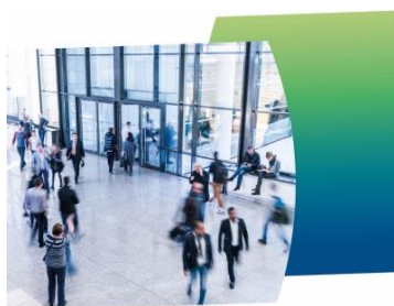
Die größten Unternehmen in Baden-Württemberg