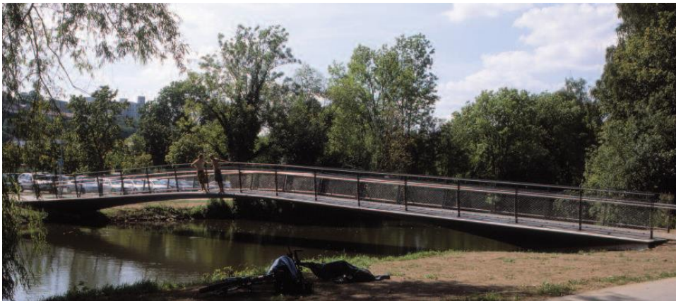
Ansichten Stahlbrücke über Altmühl bei Eichstätt

Tragwerksplanung: Grad Ingenieurplanungen, Ingolstadt