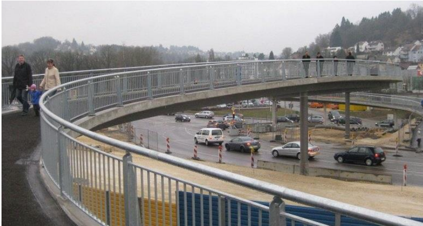
Fertiggestellte Geh- und Radwegbrücke über die B29 und die Rems, Schwäbisch Gmünd

Oben: Neue Radwegbrücke als Stahl-, Stahlbeton-Verbundbaubrücke