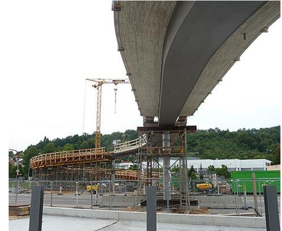
Bauphase der Verbundbaubrücke in Schwäbisch Gmünd

Unten: Neue Radwegbrücke als Stahlbrücke mit eingespannten Widerlagern