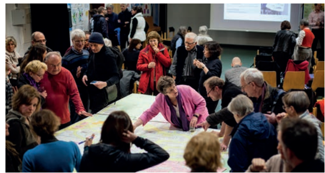
Zukunftswerkstatt in der Grundschule WHO

In der Zukunftswerkstatt, die am 9. Februar in der Grundschule Winkelwiese/Waldhäuser-Ost stattgefunden hat, diskutierten die rund 100 Teilnehmenden entlang vier zentraler Themenfelder zu den identifizierten Stärken und Verbesserungspotentialen mit der Absicht, ein erstes Zielbild für die Stadtteilentwicklung zu formulieren.