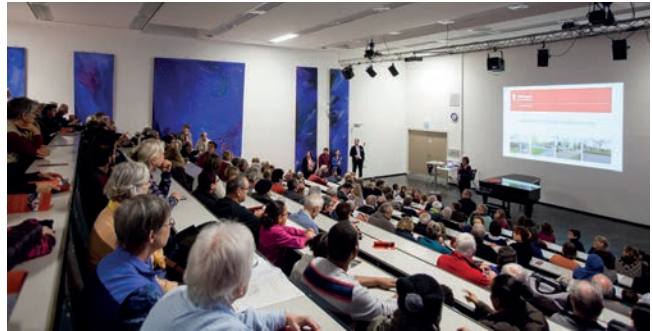
Auftaktveranstaltung in der Geschwister-Scholl-Schule.

Nach intensiver Arbeit von Seiten der Stadtverwaltung und der externen Planungsbüros konnte am 9. Mai ein erster Vorschlag für ein Maßnahmenpaket zur Antragstellung für das Programm „Soziale Stadt“ vorgestellt werden. Auf dem Platz am Stadtteiltreff/Einkaufszentrum hatten alle die 170 Interessierten die Möglichkeit, sich über die einzelnen Maßnahmen und Handlungsschwerpunkte zu informieren und ihre Anregungen und Vorschläge dazu einzubringen.