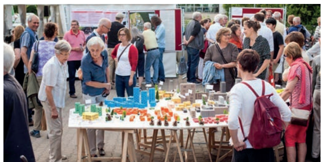
Informationsveranstaltung auf dem Platz am Einkaufszentrum

In der Zukunftswerkstatt, die am 9. Februar in der Grundschule Winkelwiese/Waldhäuser-Ost stattgefunden hat, diskutierten die rund 100 Teilnehmenden entlang vier zentraler Themenfelder zu den identifizierten Stärken und Verbesserungspotentialen mit der Absicht, ein erstes Zielbild für die Stadtteilentwicklung zu formulieren.