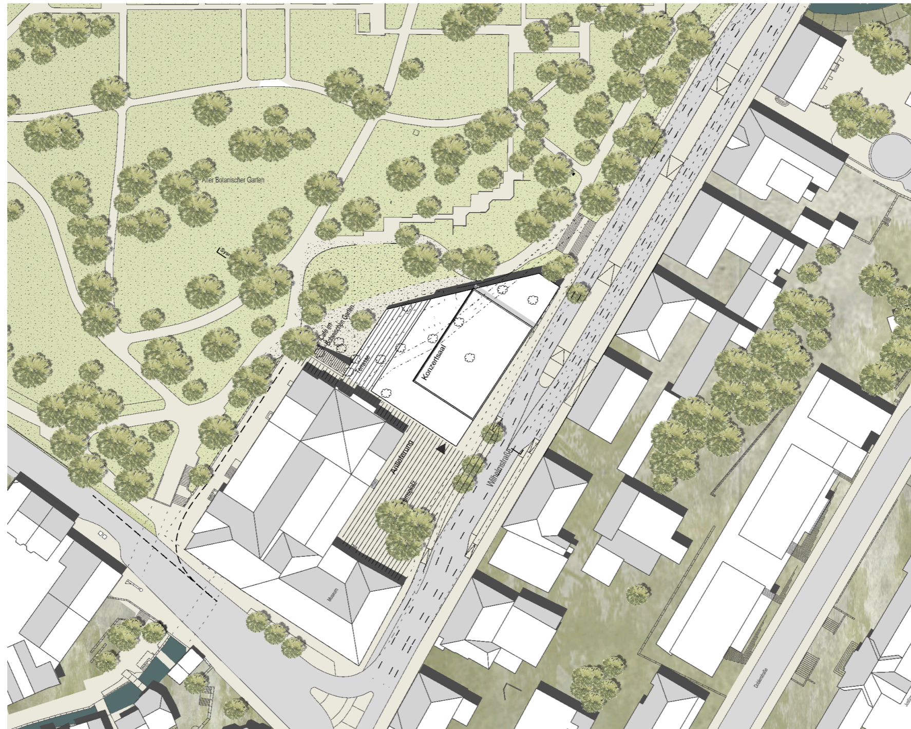
Lageplan - M 1:1000