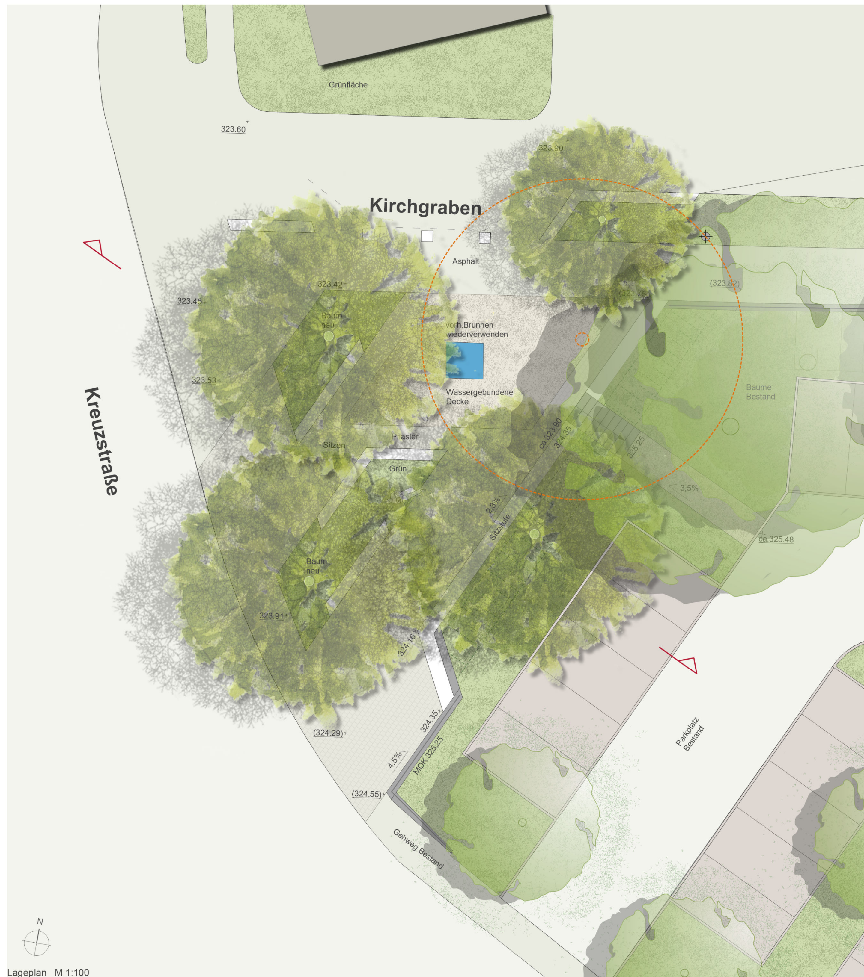
Lageplan M 1:100