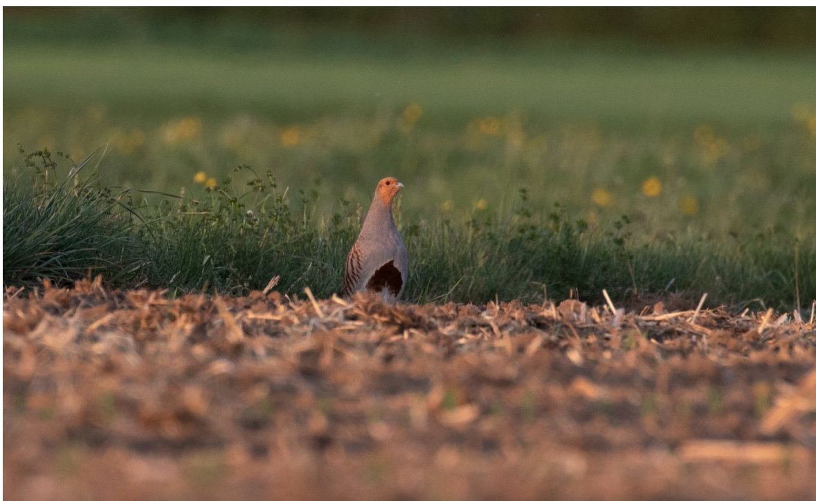
Abb. 2 Rebhahn im Neckartal 2020.

haben sich die Bestände verdoppelt, in Gebieten ohne gezielte Maßnahmen sind sie weiter zurückgegangen (KILCHLING-HINK & GEISSLER-STROBEL, in Vorb.). Dies sind die Ergebnisse des projektbegleitenden ehrenamtlichen Monitorings. Dennoch sind die aktuell etwa 50 Reviere (2020) im Landkreis Tübingen noch weit entfernt von einem dauerhaft gesicherten Bestand. Ein solcher müsste nach Erfahrungswerten etwa 250 Reviere umfassen. Weitere Maßnahmen sind deshalb dringend erforderlich.