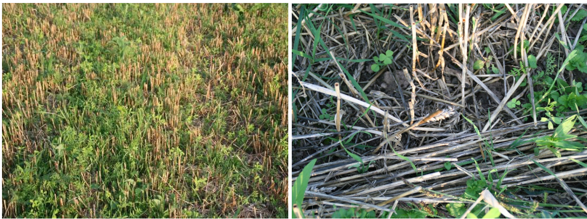
Abb.10 Mähdruschsaat einer artenreichen Gründüngung in den Stoppelacker ohne Bodenbearbeitung; das Ausfallgetreide bleibt im Herbst/Winter als Nahrung für das Rebhuhn und andere Feldvögel verfügbar.

Bei der Direkt- oder Mähdruschsaat können Zwischenfruchtmischungen beim Drusch oder kurz darauf ohne Bodenbearbeitung in den Stoppelacker gesät werden. Die Getreidereste bleiben auf der Bodenoberfläche und damit als energiereiche Nahrung für die Rebhühner verfügbar (s. Abb. 10). Hiervon profitieren aber nicht nur Rebhühner, sondern auch andere Feldvögel, wie bspw. Wiesenpiper, Feldlerche, Rohrammer und Feldsperling (DELLWISCH et al. 2018 unveröff.). Auch für die Landwirte kann dies eine win-win-Situation sein: Das Verfahren spart einen Arbeitsgang und verbessert gleichzeitig die Bodenfruchtbarkeit (ZIMMERMANN et al. 2011, KERN 2017). Aber auch Maisstoppeläcker können im Projektgebiet über Wochen wichtige Nahrungsflächen im Winter bieten (H. GÖTZ mdl.).