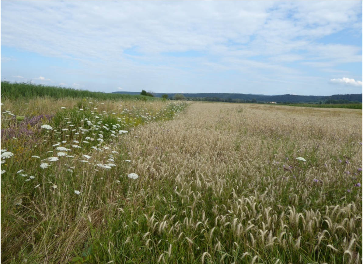
Abb. 1 Strukturreiches Bruthabitat des Rebhuhns und der Grauammer im Neckartal zwischen Wurlingen und Rottenburg: Weithin offene Landschaft mit mehrjährigen Blühbrachen, Altgrasbeständen und lückigen, nicht mit Herbiziden behandelten Getreidebeständen (Fotos im Text, wenn nicht anders benannt: S. GEISSLER-STROBEL).