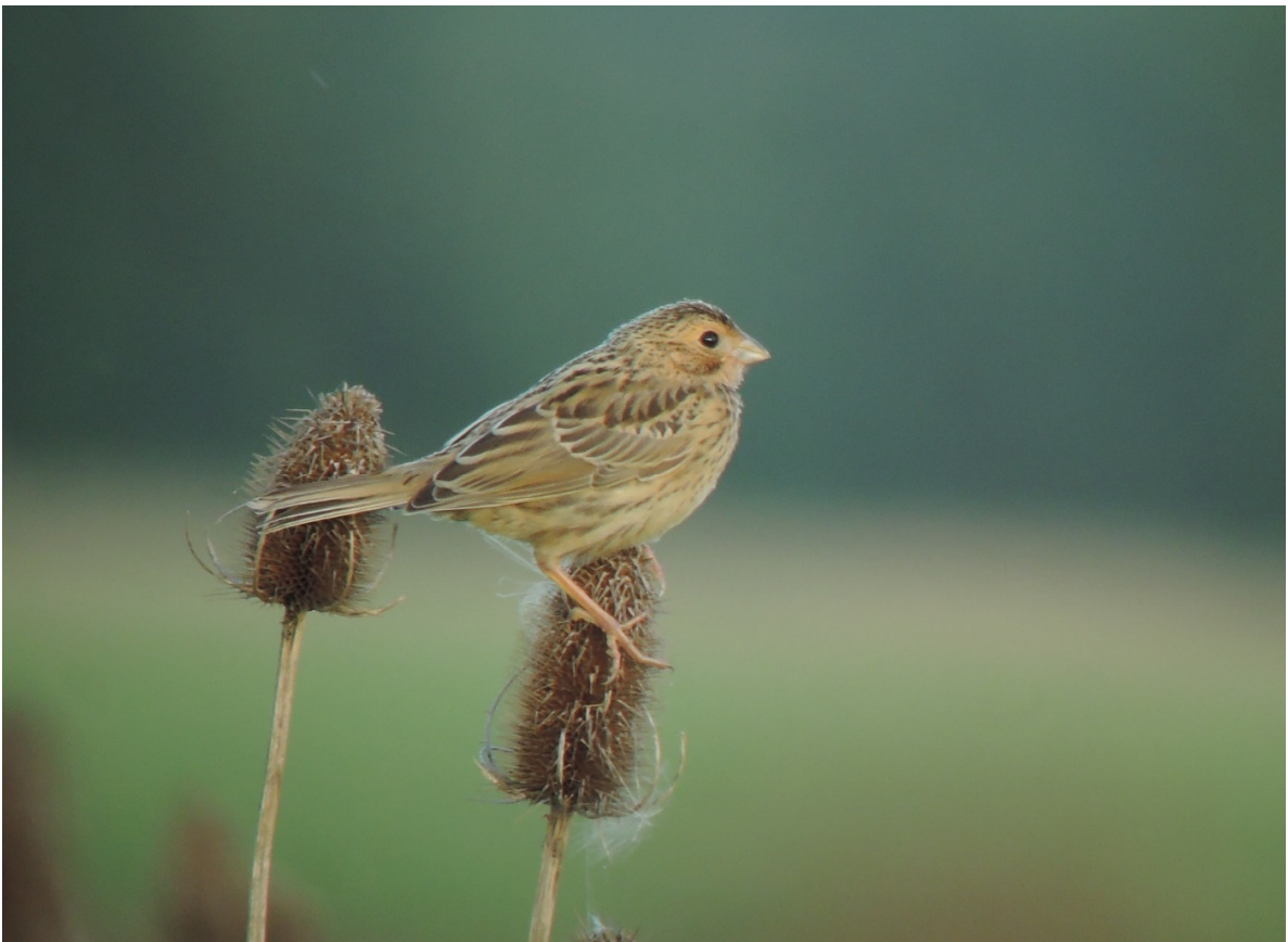
Abb. 3 Junge Grauammer auf „Wilder Karde“, einer typischen Pflanzenart in mehrjährigen Brachen.

Auch die Grauammer hatte landesweit und auch im Landkreis Tübingen dramatische Bestandsrückgänge zu verzeichnen und ist landesweit vom Aussterben bedroht. 1984 noch mit 159 Revieren in den Niederungsgebieten von Steinlach-, Ammer- und Neckartal weit verbreitet (s. KRATZER 1991), konnten 2005 bei einer Wiederholungskartierung nur noch 21 Reviere erfasst werden (Daten: Kratzer 1991 und Datenbank R. Kratzer). Diese waren auf drei Teilgebiete bei den Heuberger Höfen und im Neckartal (beide Gemarkung Rottenburg) sowie Hirrlingen beschränkt. Die regelmäßigen Vorkommen im Steinlach- und Ammertal waren bereits erloschen. Im Ammertal waren nur noch Einzelreviere sporadisch besetzt, zuletzt 2011 (s. STRAUB & GEIBLER-STROBEL 2012). Auch das Vorkommen bei Hirrlingen ist inzwischen erloschen. Die letzten Reviere im Neckartal auf Tübinger Gemarkung wurden im Jahr 2012 westlich von Bühl erfasst (MENZ & KRAMER 2017, in Datensatz der OGBW), im Ammertal 2011 (s. STRAUB & GEISLER-STROBEL 2012). Seither wurden allenfalls noch einzelne kurzzeitig besetzte Gesangsplätze dokumentiert, zuletzt im Frühjahr 2020 im nördlichen Neckartal, westlich von Tübingen-Hirschau.