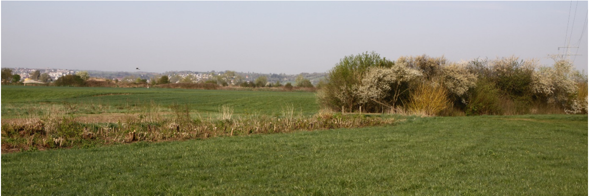
Abb. 7: Wichtige Teilmaßnahme in Rebhuhnschutzgebieten ist das regelmäßige „auf den Stock setzen“ vorhandener Hecken, um diese als Niederhecken zu entwickeln und zu erhalten. Am Arbach südwestlich von Tübingen-Hirschau pflegt die Stadt Tübingen die Begleitgehölze seit einigen Jahren als Niederhecke. Diese werden inzwischen wieder regelmäßig von Rebhühnern mitgenutzt.