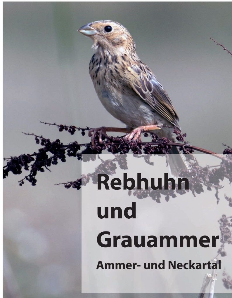
Rebhuhn und Grauammer Ammer- und Neckartal