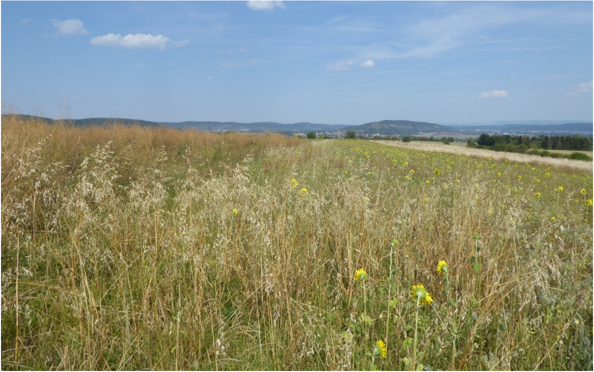
Abb. 5: Mehrjährige Blühbrache nach dem Göttinger Modell im 2. Standjahr: Die Hälfte des Bestandes wurde im Frühjahr umgebrochen und neu eingesät – vorjährige und diesjährige Bestände unterscheiden sich strukturell. In den Altbeständen brüten die Rebhühner, die lückigeren neu angesäten Bestände dienen den Küken zur Nahrungssuche.