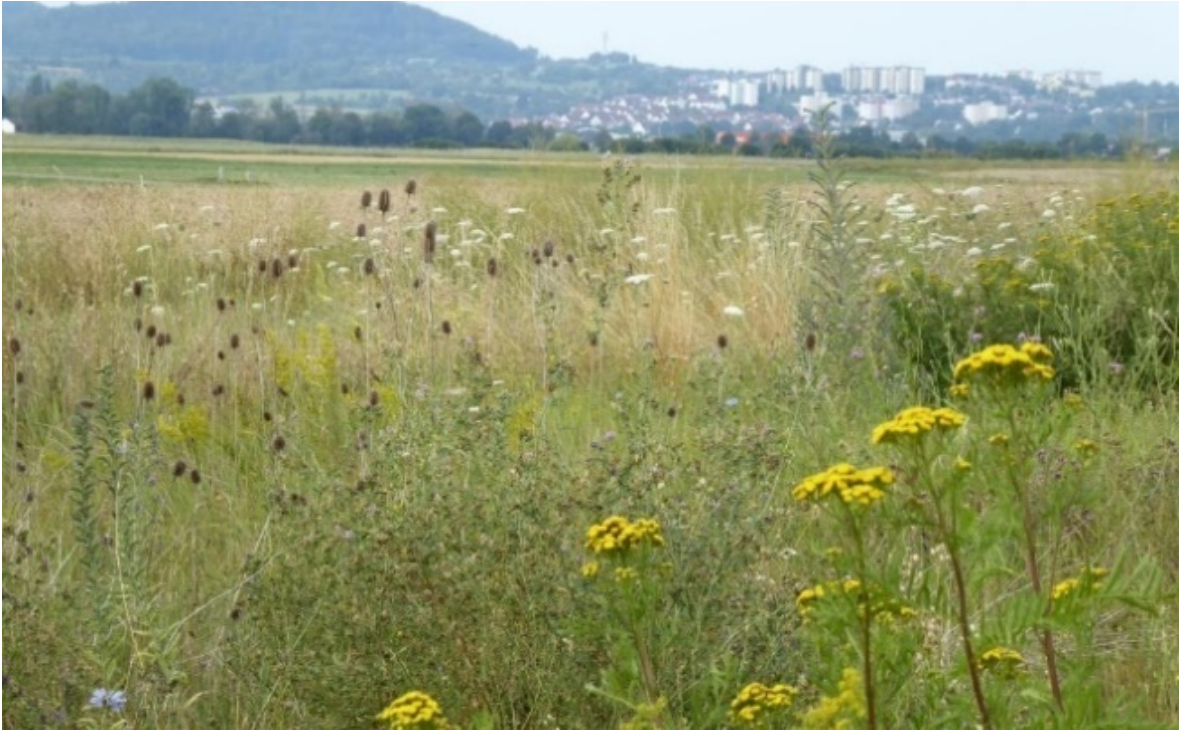
Abb. 4: Mehrjährige Blühbrachen nach dem Tübinger Modell im 4. bzw. 5. Standjahr: Regelmäßig besetzte Revierzentren des Rebhuhns und zeitweise auch der Grauammer.