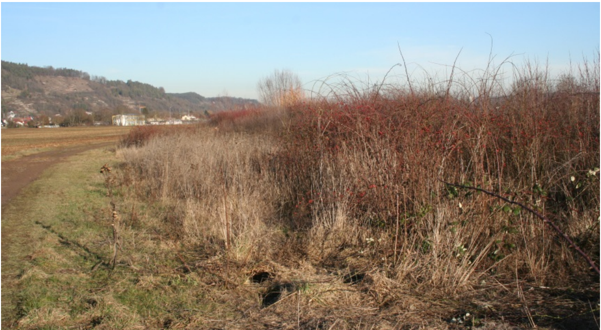
Abb. 8: Von der Stadt Tübingen regelmäßig gepflegte Niederhecke am Arbach im nördlichen Neckartal; günstige Rebhuhnstrukturen sind hier die niedrigen Dornenbüsche und Altgrasbestände.

Auf Neupflanzungen von Gehölzen sollte in Rebhuhn- und Grauammer-Brutgebieten generell verzichtet werden, um die Entstehung beeinträchtigender Gehölzkulissen zu vermeiden und den finanziellen Aufwand für die dauerhafte Pflege im Rahmen zu halten. Ersteres betrifft gleichermaßen die Anlage von Kurzumtriebsplantagen zur energetischen Nutzung oder Agroforstsysteme. Weitere Hinweise zur Heckepflege finden sich im Maßnahmenkatalog im Anhang.