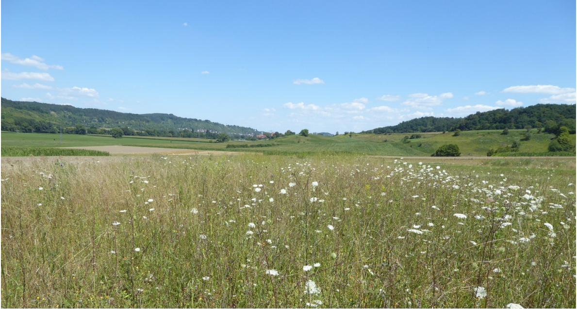
Abb. 6: Mehrjährige Ackerbrache aus Spontanbegrünung: Langjährig regelmäßig besetztes Rebhuhnrevier im östlichen Ammertal. Als Rebhuhnbrutplatz eignen sich solche Flächen nur, wenn sie nicht jährlich gemäht oder gemulcht werden. Geeignete Pflegemaßnahmen beschränken sich auf die punktuelle Zurückdrängung ggf. aufkommender Gehölze.