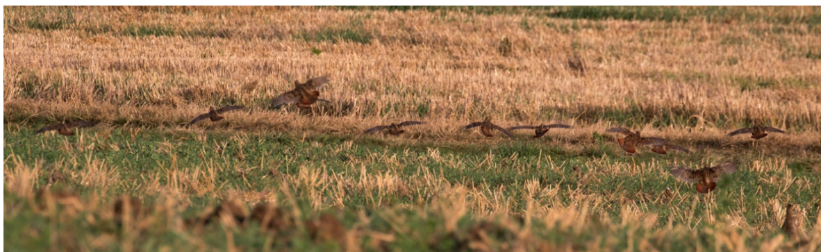
Abb. 9 Rebhuhnkeule in einen Getreide-Stoppelacker einfliegend. Stoppeläcker bieten im Winter Nahrung und Deckung. Sie waren früher auch im Landkreis Tübingen ein wichtiger Bestandteil der Rebhuhnlebensräume.

Das Rebhuhn ist ein Standvogel und bleibt im Winter in den Brutgebieten. Stoppeläcker bieten dann eine besonders günstige Nahrungsressource und zugleich Deckung. Die bis weit in den Winter hinein stehenbleibende Getreidestoppel war im Tübinger Raum früher ein wichtiger Rebhuhn-Lebensraum (KRATZER mdl.). Dort fanden die Vögel reichlich energiereiche Nahrung in Form von Ernteresten und Ausfallgetreide. In der heutigen landwirtschaftlichen Praxis werden Stoppeläcker im Regelfall direkt nach der Ernte bodenbearbeitet. Die auf dem Acker verbliebenen Erntereste sind dann für das Rebhuhn und andere Feldvögel nicht mehr zugänglich. Auch für Grauammer und andere Vogelarten wie Feldlerche und Rohrammer stellen solche Stoppelbrachen wichtige Nahrungsflächen dar (DONALD & EVANS 1994, DELLWISCH et al. 2018).