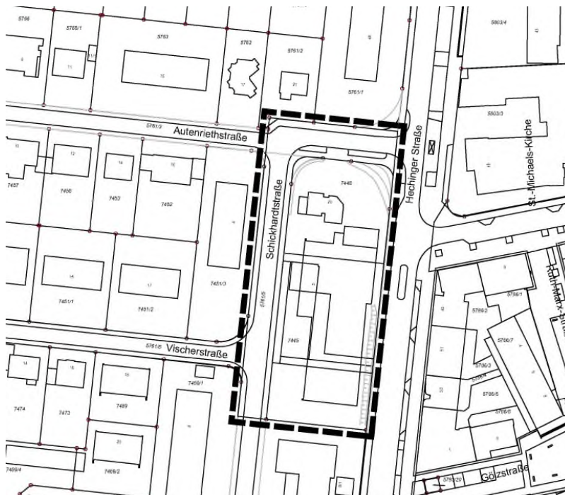
Abb. 1 Geltungsbereich Bebauungsplan

Teile der Flurstücke 5761/3 und 5761/5 werden für die Umsetzung des Vorhabens benötigt. Die insgesamt ca. 60 m 2 große Flächen wird die Stadt an die GWG Tübingen mbH veräußern.